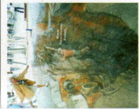
Opera di Chiara Spataro

Un atelier di pittura allestito in un luogo pubblico. Accade al BicoCCA Village di via Chiese 60 dove, da venerdì 1 per un mese intero (info 02.66101276) la giovane artista milanese Chiara Spataro sarà animatrice di una serie di interventi a carte scoperte, fra dipinti "in progress" come classici quadri da cavalletto (dall'1 all'18 luglio) e opere monumentali in 3D nel più noto stile del trompe l'oeil da strada, con crepacci aperti sotto i piedi dei visitatori, così realistici da aver paura di caderci dentro (dal 9 al 14). Anche un corso di trompe l'oeil (sabato 16 ore 15-19), per apprendere i segreti dell'antica tecnica di illusione pittorica.